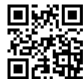
浴室ミラーの交換方法

→鏡の取り外し及び、新しい鏡の取付方法をチェックしてください。交換に必要な工具等もご紹介しています。